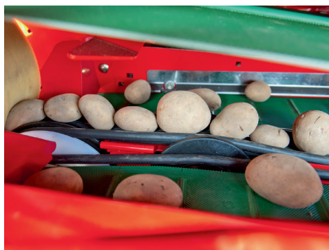
Store og små kartofler ligger tæt sammen.

Konceptet i maskinen er at kartoflerne kører fremad på en række gummi elastikker, hvor de ligger på en række, som perler på en snor. Kartoflerne ligger helt tæt sammen på elastikkerne, ved at de midterste elastikker